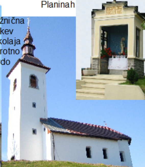
Podružnična cerkev Sv. Nikolaja Praprotno Brdo