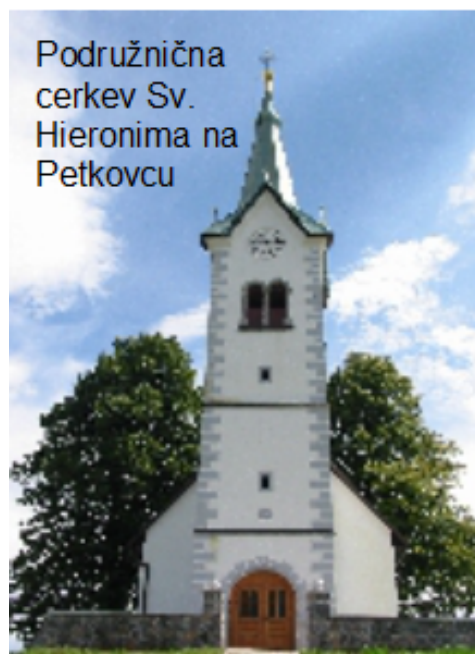
Podružnična cerkev Sv. Hieronima na Petkovcu